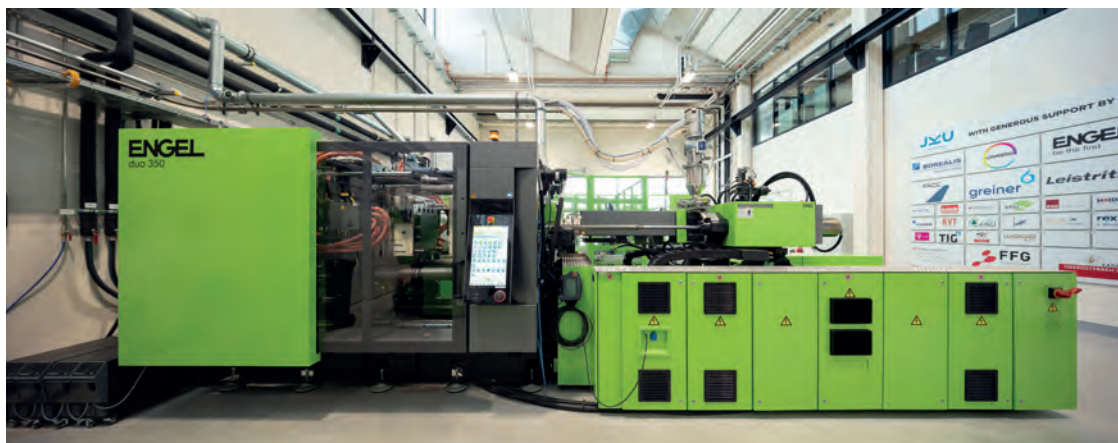
Bild 4. An der LIT Factory in Linz wurden in einem integrierten Prozess seriennahe Musterteile produziert

dünnen Organoblechen entscheidend ist, um den Prozess umsetzen zu können.