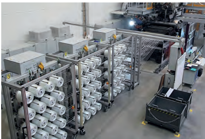
Bild 2. Das für die Versuche eingesetzte Composite-Material wurde von Profol aus Glasfasern und Polypropylen produziert

Entscheidend für Leichtbauanwendungen ist neben der Steifigkeit vor allem die hohe mechanische Belastbarkeit des Materials, die nur sichergestellt werden kann, wenn die Länge der Fasern erhalten bleibt und die Fasern gleichmäßig in der Matrix verteilt sind. Herkömmlich resultieren aus langglasfaserverstärkten »