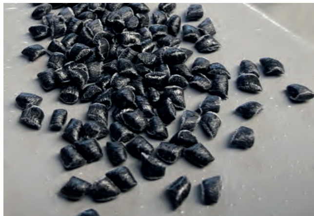
Bild 1. Für die Versuche wurde aus Organoblech-Verschnittabfällen auf Basis von UD-Tapes (links) ein Regranulat (rechts) hergestellt

der Verschnittanteil aber auch 35 % und mehr betragen. Das Recycling dieser Produktionsabfälle ist damit nicht nur ein Beitrag zu mehr Nachhaltigkeit, sondern auch zur Kostenersparnis.