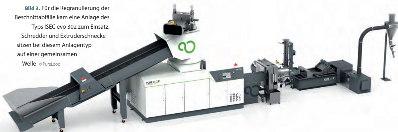
Bild 3. Für die Regranulierung der Beschnittabfälle kam eine Anlage des Typs ISEC evo 302 zum Einsatz. Schredder und Extruderschnecke sitzen bei diesem Anlagentyp auf einer gemeinsamen Welle